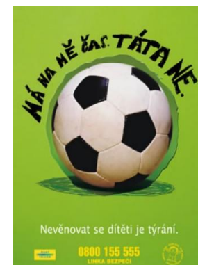
Ukázka z kampaně proti psychickému týrání - rok 2001