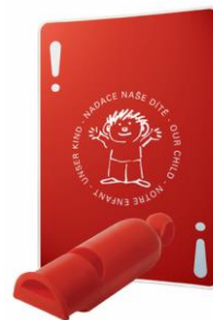
Ukázka z kampaně „STOP násilí na dětech“ - rok 2005 - 2006